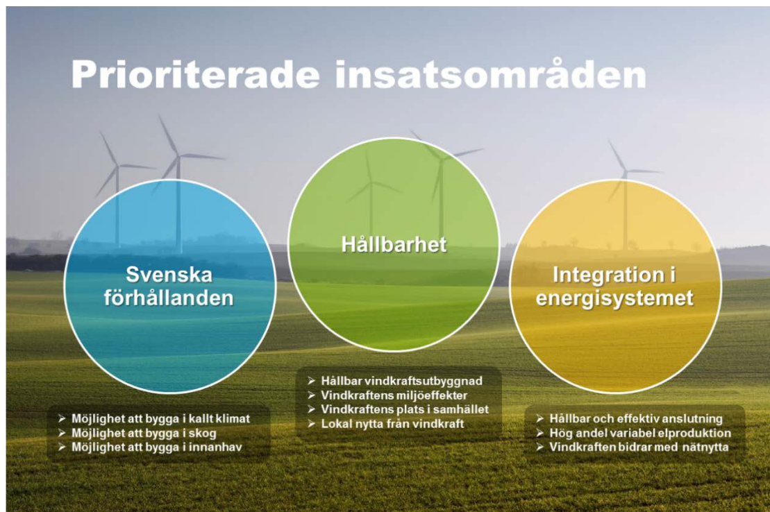
Figur 1. Prioriterade områden i Energimyndighetens vindkraftsstrategi 2016-2017